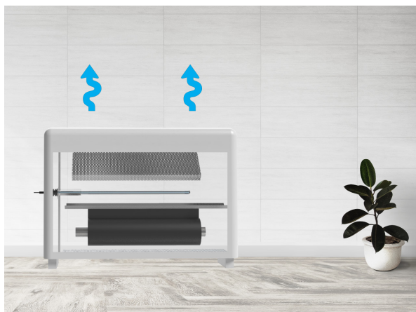
Applicazione su FANCOIL

La serie UV-STYLO-X comprende una scelta di modelli pensati per installazioni in spazi molto ristretti. Il device è composto da una flangia in acciaio INOX AISI 304 sulla quale è alloggiata una lampada UV-C protetta da un bulbo di quarzo puro.